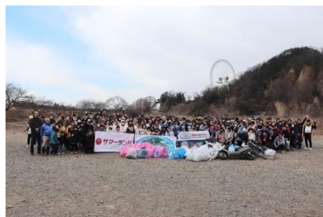
「秋川クリーンアップ 2025」の様子