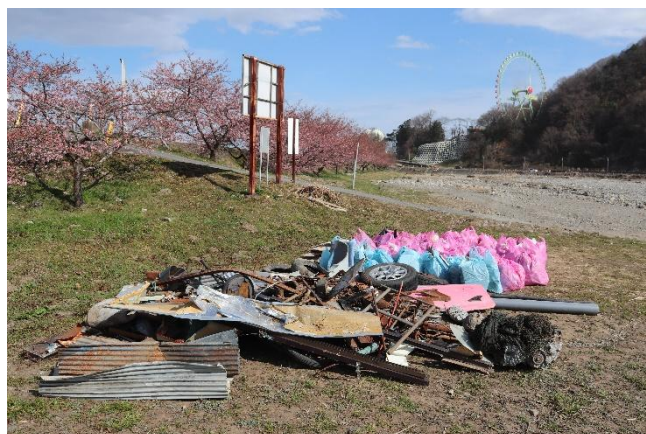
回収されたゴミ(左:2024年実施時 右:2023年実施時)